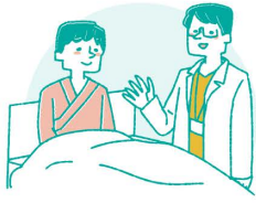
ご家族の急な入院

医療保険証を持っている（※入院費は医療保険でのご請求となります） 現在、在宅で介護や療養を受けている方 当院で対応可能な病状の方 在宅療養が再開できない方 ※ご病状によっては入院をお断りさせて頂く場合もあります。