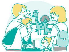
ご家族の出張や旅行