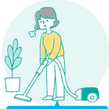
ご家族の介護疲れ