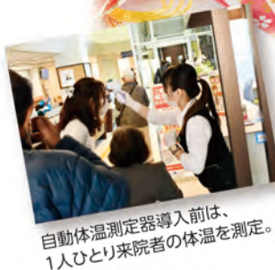
自動体温測定器導入前は、 1人ひとり来院者の体温を測定。