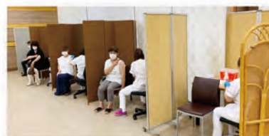
市内企業の職域接種や、 大規模接種の職員派遣なども実施。