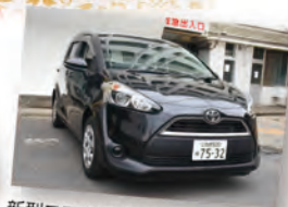
新型コロナ陽性者や濃厚接触者の 移送用専用車両を計2台導入。